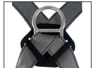
Auffangöse (D-Ring), geschmiedeter Stahl