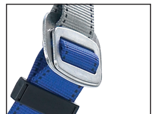
Steckverschluss (Bein), galvanisch verzinkt